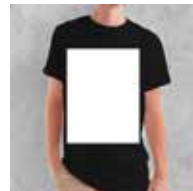
ca. 56 x 50 cm