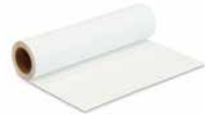
ca. 56 x 100 cm