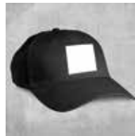
ca. 6 x 6 cm