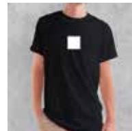
ca. 10 x 10 cm